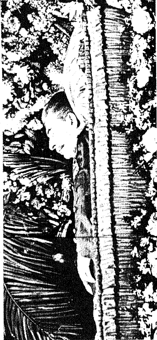
جثمان ستالين مسجى في الكرملين.